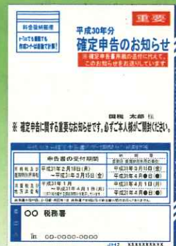
「確定申告のお知らせ」はがきイメージ

※「確定申告のお知らせ」はがきとは、予定納税額などの申告書の作成に必要な情報を記載したはがき（又は封書）です。